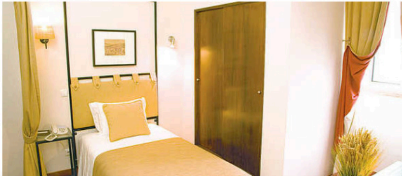
AIRE FAMILIAR EN UN HOTEL BOUTIQUE

21 Enero 11 - Madrid - J. A. Narro Prieto