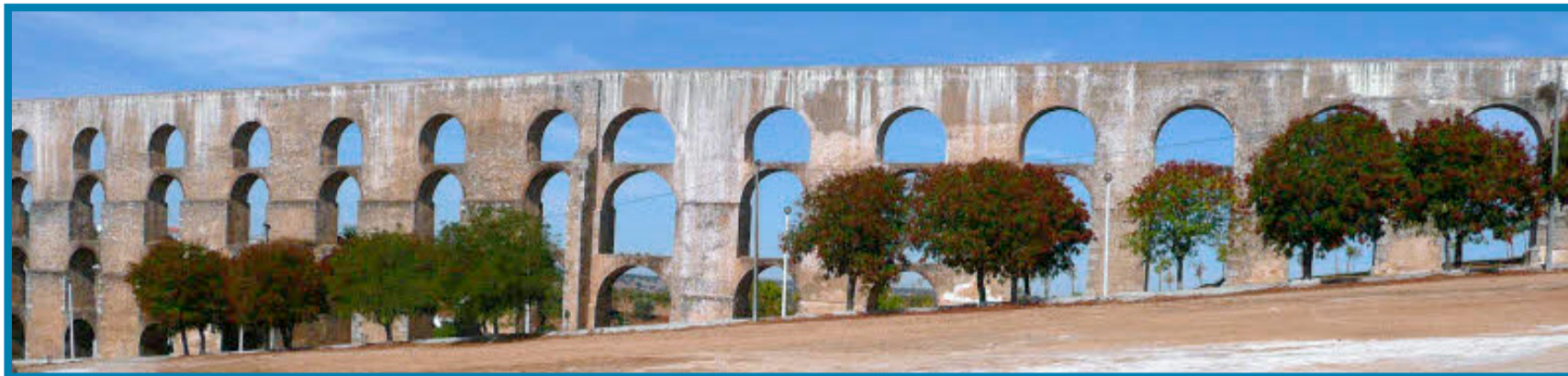
Imposant: Acht Kilometer lang und 30 Meter hoch ist das Aquädukt von Elvas, das den Besucher am Stadteingang empfängt.