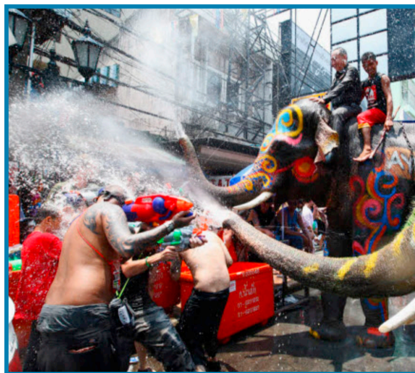
Nur Tage nach den blutigen Auseinandersetzungen zwischen Oppositionellen und der Polizei feierten die Menschen in Bangkok das sogenannte Songkran-Neujahrsfest. Die Lage in Thailand bleibt allerdings instabil.